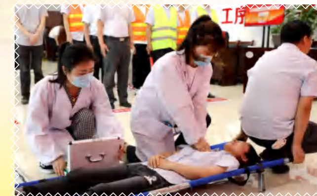
现场医疗救护，抢救于瞬间