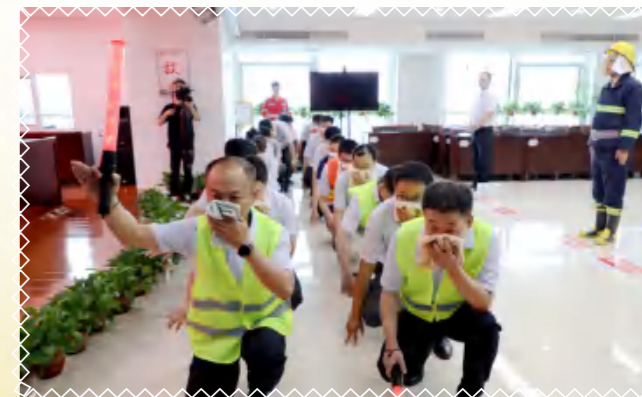
发现着火点，逃生依次有序