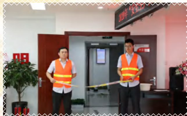
拉紧警戒带，疏散不容忽视