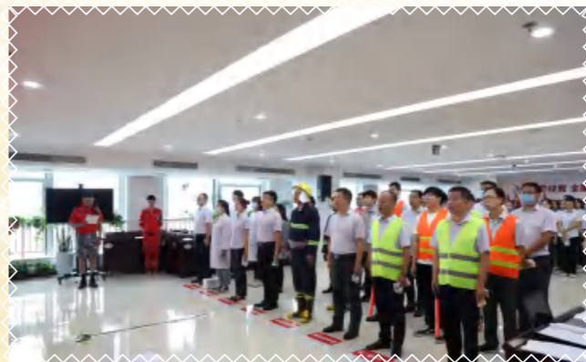
分组速集结，演练一触即发