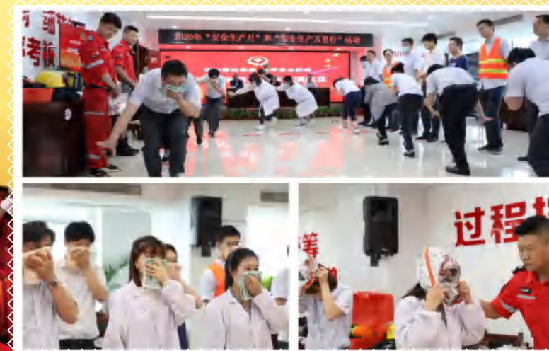
消防自救增技能，挑战急速“秒行动”