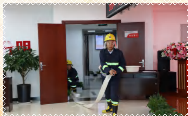
启动消防栓，隔绝助燃物品