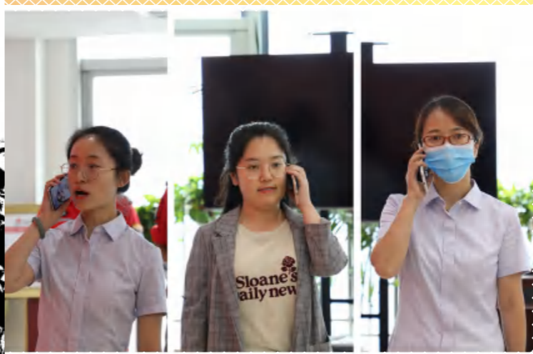
启动应急预案，及时报警支援