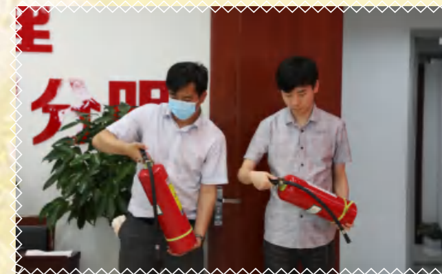
检查灭火器，紧急制动操作